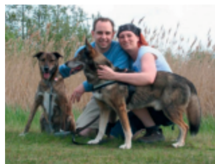
ein gutes Zuhause gefunden

Öffnungszeiten: Montag bis Freitag: 15:00 bis 18:00 Uhr Mittwochs geschlossen Samstag: 12:00 bis 15:00 Uhr Jeden 1. Sonntag im Monat: 12:00 bis 15:00 Uhr