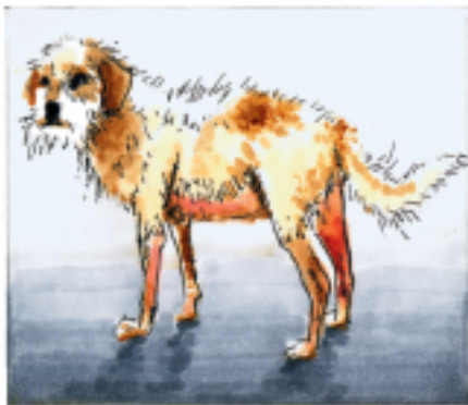
Dies und viel mehr geschieht viel häufiger, als Sie es für denkbar halten.