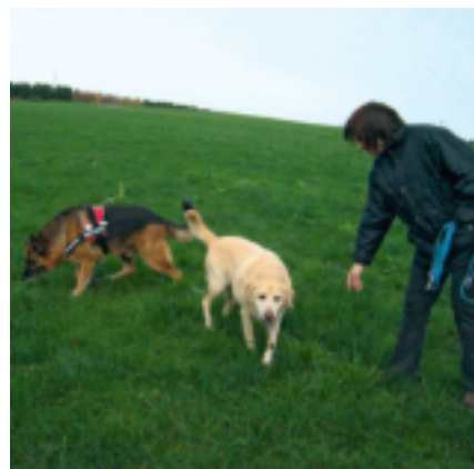
Abwechslung, Variation, immer neue Bewegungen und Aktionen trainieren soziale Konventionen

Wenn Sie bereit wären, z.B. nachts oder an Sonn- und Feiertagen Anrufe entgegen zu nehmen, um Tieren in Not zu helfen, wäre uns das eine große Hilfe. Je mehr Helfer sich dazu bereit erklären, desto weniger Belastung bedeutete das für den Einzelnen.